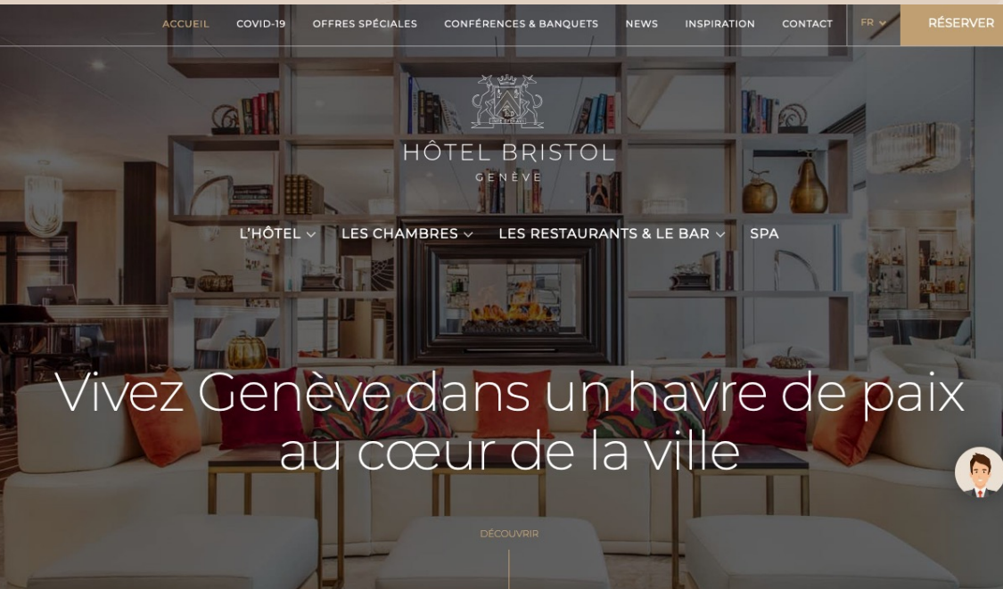
Hôtel Bristol - Refonte intégrale du site